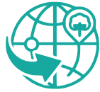
Sourcing & Procurement