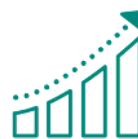
Prévision de la demande