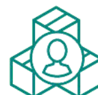
Portail des fournisseurs