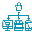
La gestion des commandes